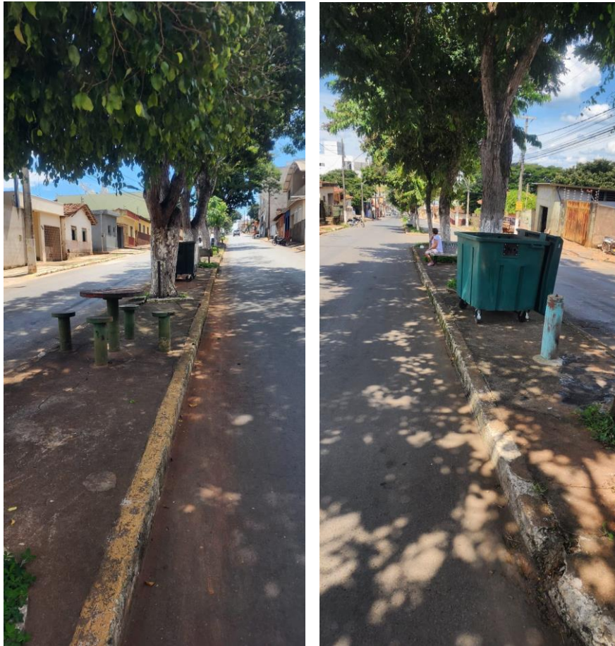
Foto 02: Jardim centra na avenida Jair Leite - Local da regularização do meio fio e instalação Pavimento Intertravado.

Engenheiro civil – Flávio César Porto de Figueiredo CREA-MG: 345.592/D