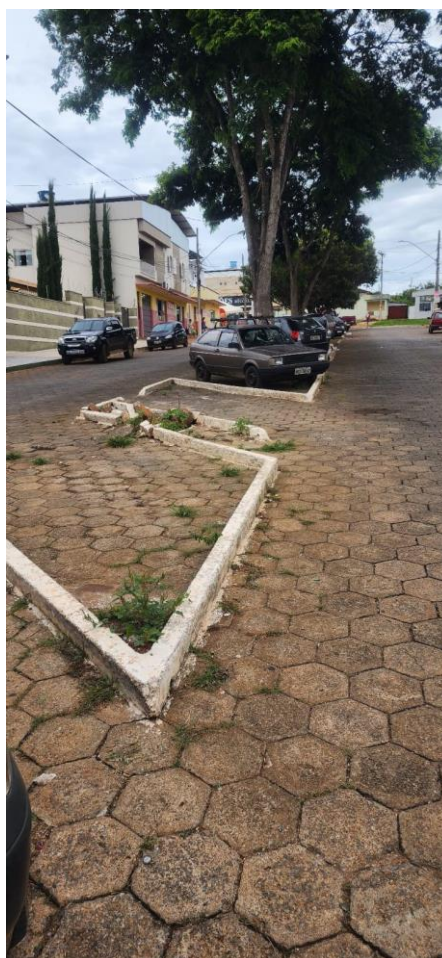
Foto 01: Jardim centra na avenida JK - Local da execução do meio fio e instalação Pavimento Intertravado.